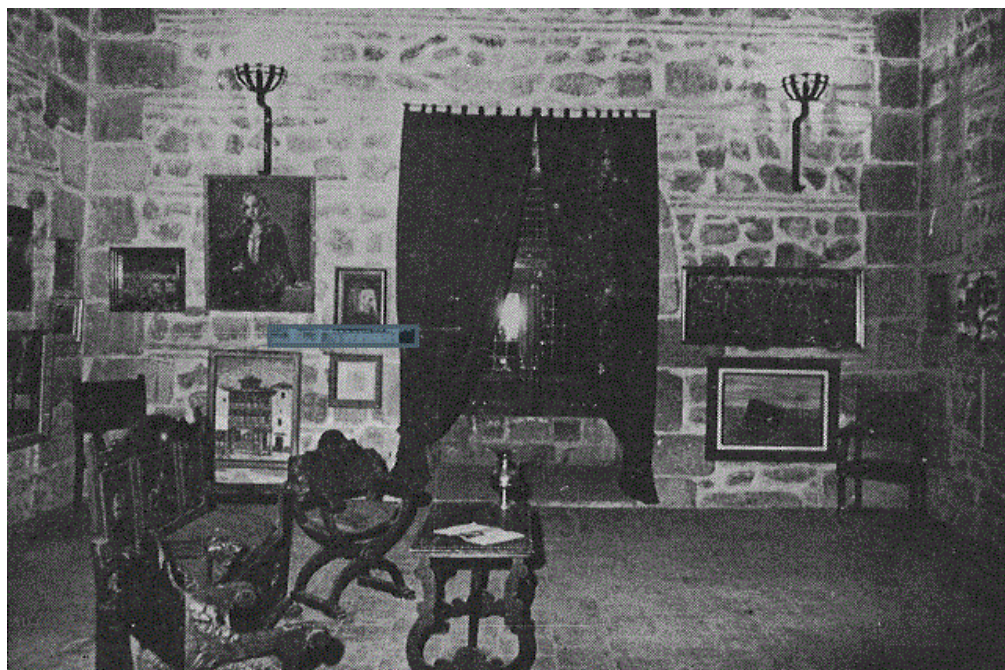
Galería de Arte - Museo El Doncel. 2ª planta del Torreón Don Juan de Austria. 1973