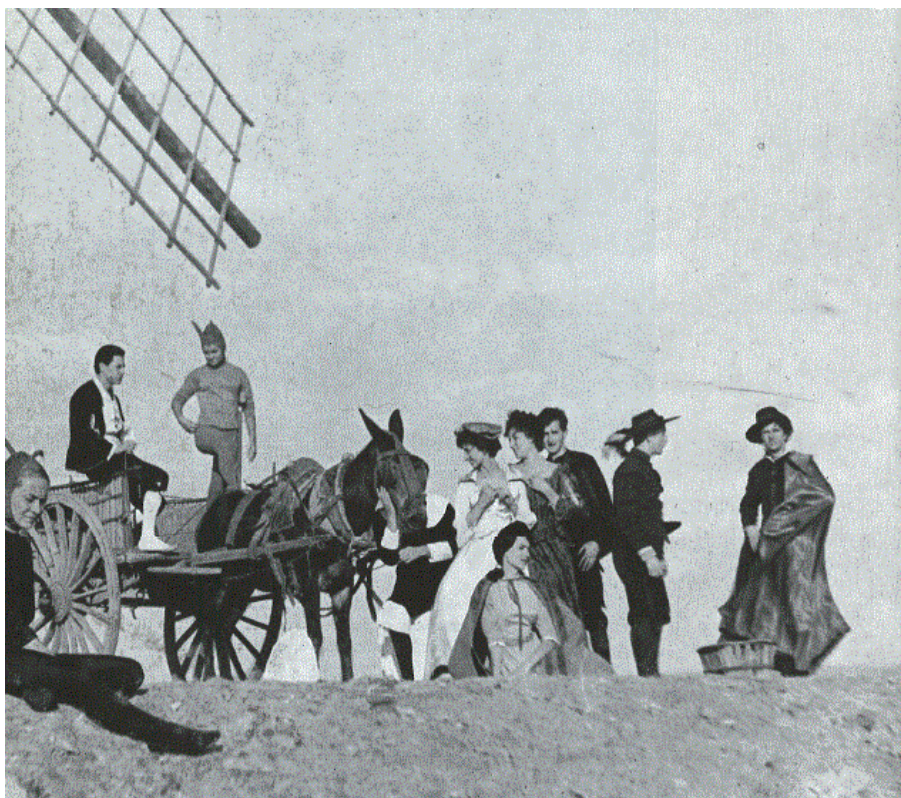
Alumnos del Conservatorio de París interpretando “El diablo cojuelo” ante el molino El Doncel.

Entre los distintos actos que se celebraron en esos días, destacar la interpretación que los alumnos del Conservatorio hicieron, a las puertas del molino, de la obra satírica “El Diablo cojuelo” , de Luis Vélez de Guevara. Y las dos que hicieron en el Teatro Crisfel: la comedia “Chinchín comediante” de Pio Baroja y la obra dramática “Los empeños de una casa” de la mejicana Sor Juana Inés de la Cruz.