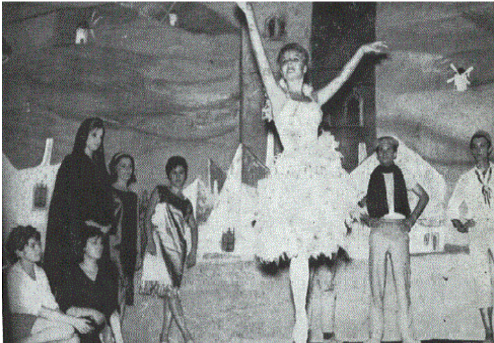
Una representación de los alumnos del Conservatorio de Arte Dramático de París

representaciones encantados de actuar y fotografiarse junto a esos extraordinarios vestigios de la historia de Alcázar.